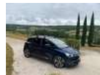
Renault Scénic IV, ontwerp: Laurens van den Acker.